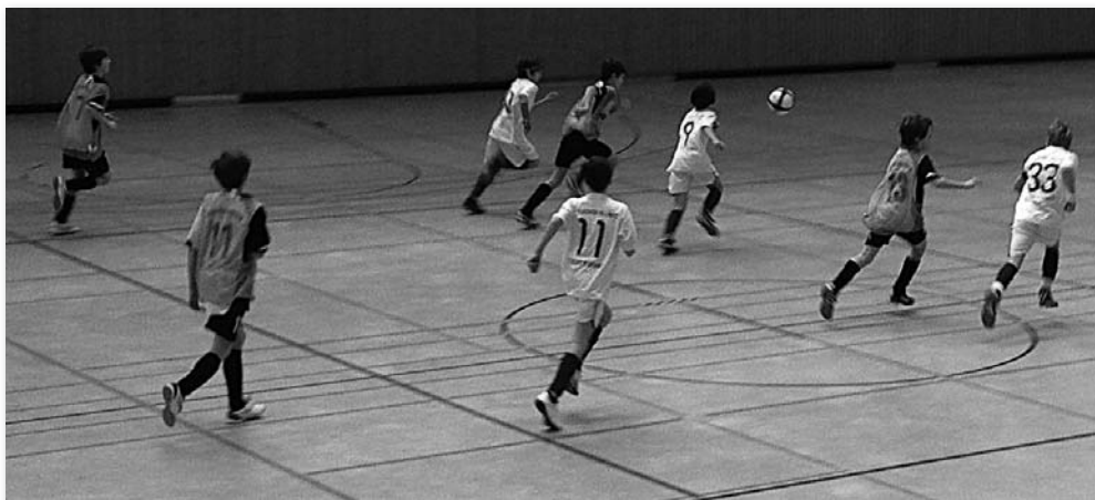
D1 Junioren in Aktion

Der TV Aldingen war der nächste Gegner der D2 und konnte schnell 2 Tore vorlegen. Die D2 bäumte sich auf und hielt bis Mitte der Halbzeit tapfer mit, doch dann ging es Schlag auf Schlag und Aldingen führte plötzlich mit 6:0. Die D2 brachte noch einmal Gegenwehr auf und hatte kurz vor Schluss sogar die Möglichkeit zum Gegentreffer doch es blieb leider beim 0:6 für Aldingen.