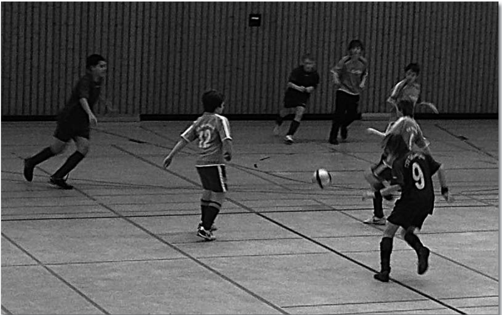
D2 Junioren spielen auf

noch die Chance zum Sieg. Jetzt hing alles vom Ausgang des Spiels VfB Oberesslingen gegen SG Dornstetten ab. Oberesslingen durfte mit maximal 3:0 gewinnen damit die D1 noch ins Halbfinale kommt, sie taten uns jedoch diesen Gefallen nicht und schossen Dornstetten mit 5:0 regelrecht ab und das Halbfinale stand nun für Oberesslingen offen.