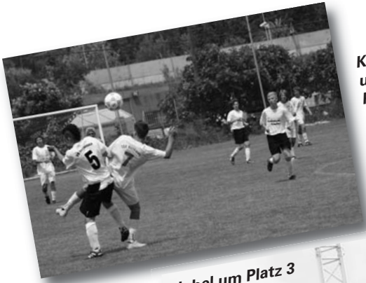
Kampf um Platz 3