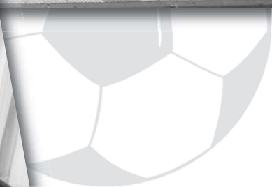
Im Nou Camp