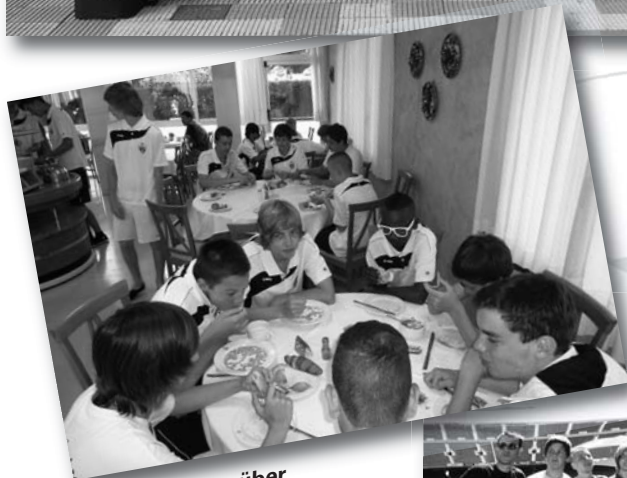
Es geht nichts über ein gutes Frühstück