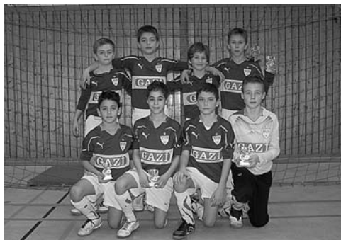
E1-Junioren – VfB Stuttgart