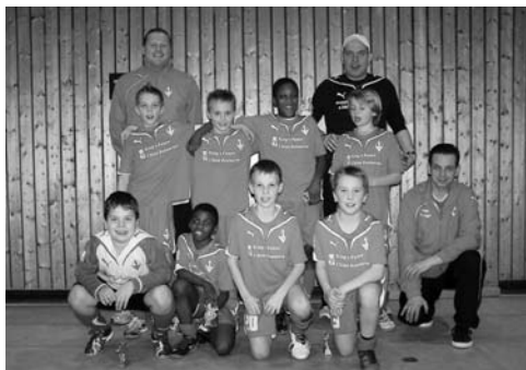
E2-Junioren – SV Vaihingen2