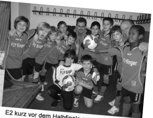
E2 kurz vor dem Halbfinale gegen Echterdingen