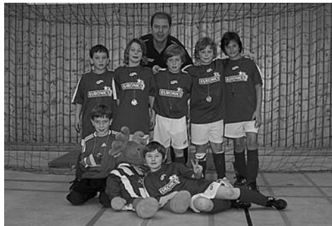
F-Junioren – TSV Wendlingen