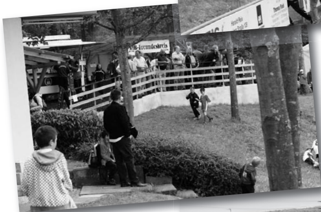
Maihock und Jugend-Feld-Turniere